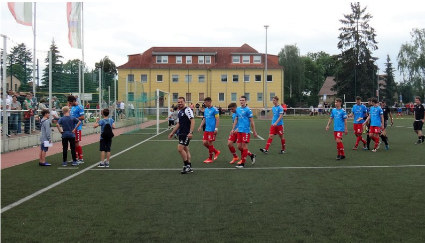
Eintracht Glindow vs. Babelsberg 03