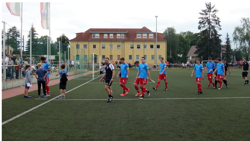
Eintracht Glindow vs. Babelsberg 03