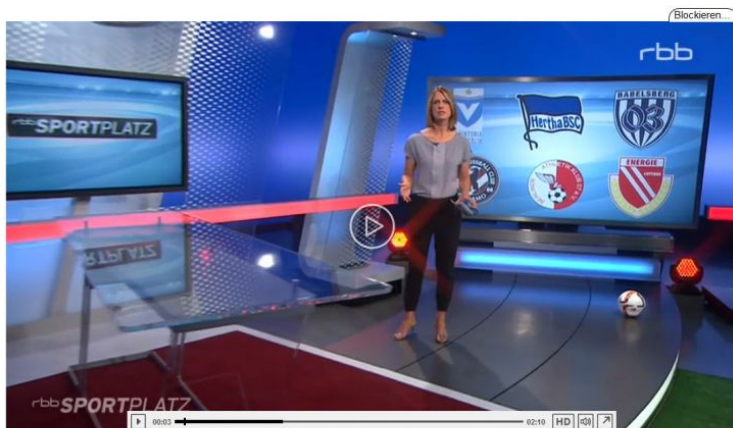
So 22.05.2016 | 22:00 | rbb Sportplatz Regionalliga 2016/2017