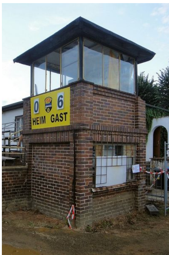
Die überforderten Gastgeber am Bierstand waren denn auch