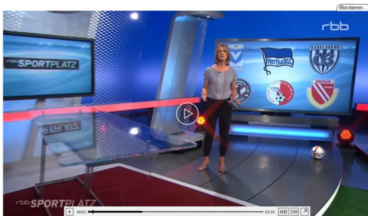
So 22.05.2016 | 22:00 | rbb Sportplatz Regionalliga 2016/2017